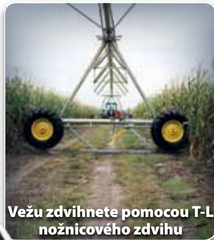
Vežu zdvihnete pomocou T-L nožnicového zdvihu