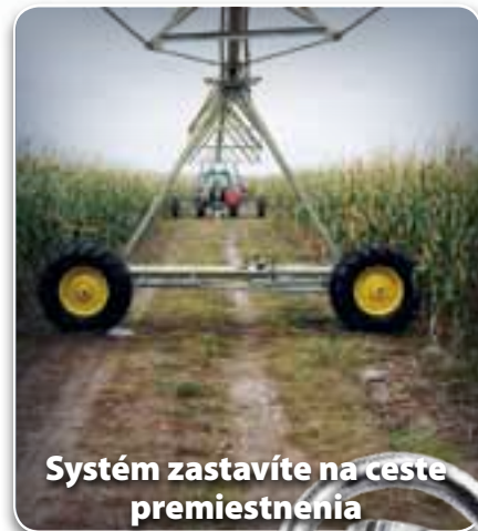
Systém zastavíte na ceste premiestnenia

To Vám umožní spo'ahlivý a bezpečný hydraulický pohon.