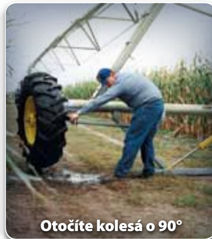
Otočíte kolesá o 90°