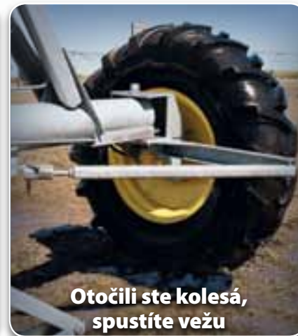
Otočili ste kolesá, spustíte vežu