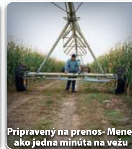
Pripravený na prenos- Menej ako jedna minúta na vežu